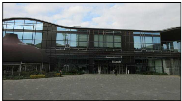
▲みんなの森ぎふメディアコスモス