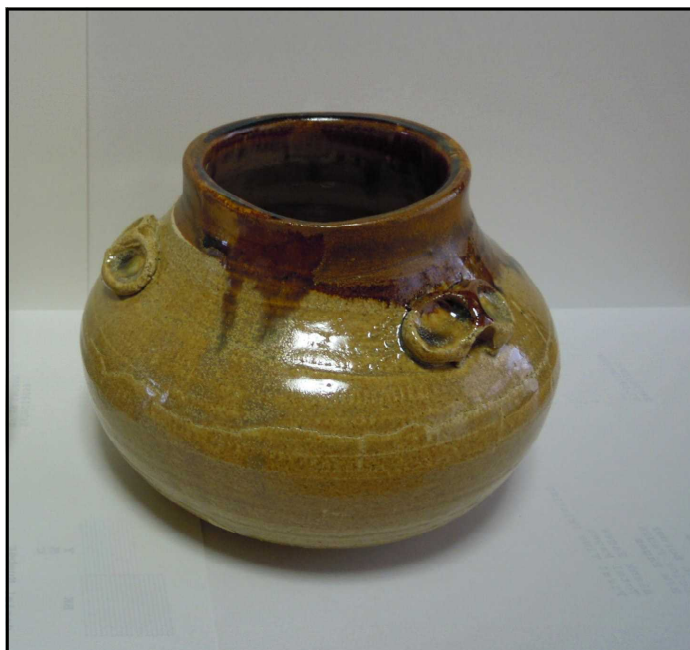
陶芸 長谷川秀次 花瓶

来年度の「あおぎり展」へ向けて、可児支部会員の皆様方の出品を期待しております。ご協力よろしくお願いいたします。