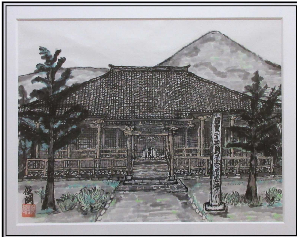
絵画(水墨画) 高木俊朗 願興寺