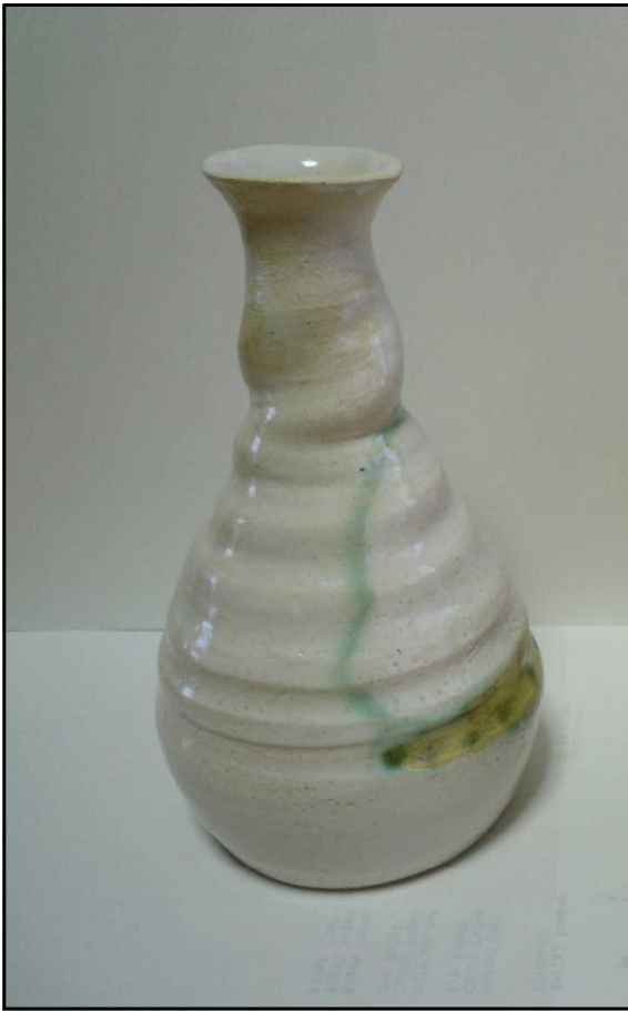
陶芸 長谷川秀次 一輪挿し